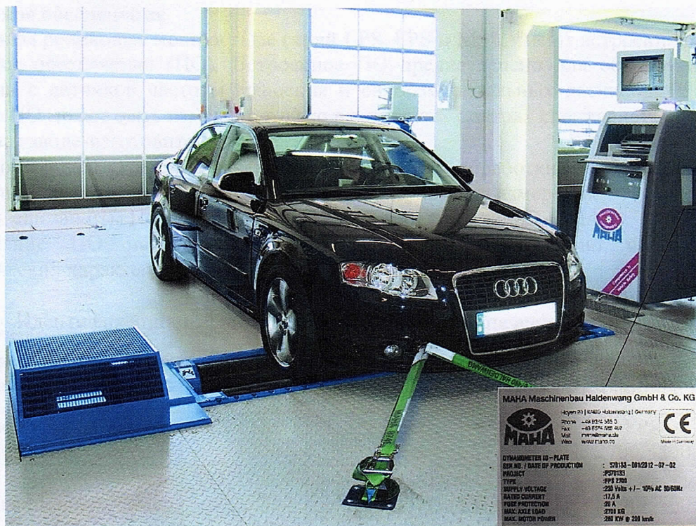
Рисунок 2 – Общий вид стенов роликовых мощностных серии FPS