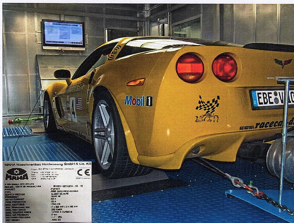
Рисунок 3 – Общий вид стенов роликовых мощностных серии MSR

Пломбирование агрегатов и узлов стенов роликовых мощностных серий LPS, FPS и MSR не предусмотрено.