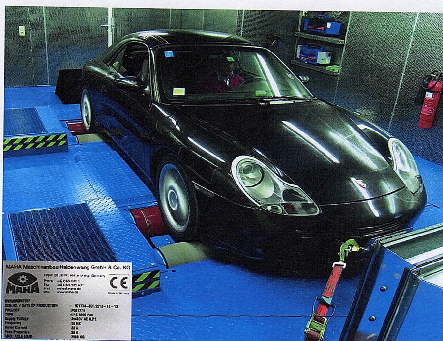
Рисунок 1 - Общий вид стендов роликовых мощностных серии LPS

Общий вид стендов представлен на рисунках 1 - 3.