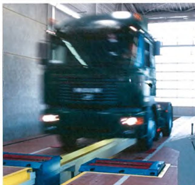
Рисунок 4 – Общий вид стандов тормозных роликовых силовых серии MBT 4000