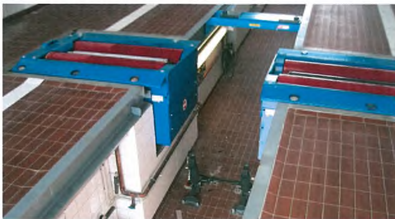
Рисунок 7 – Общий вид стенов тормозных роликовых силовых серии MBT 7000