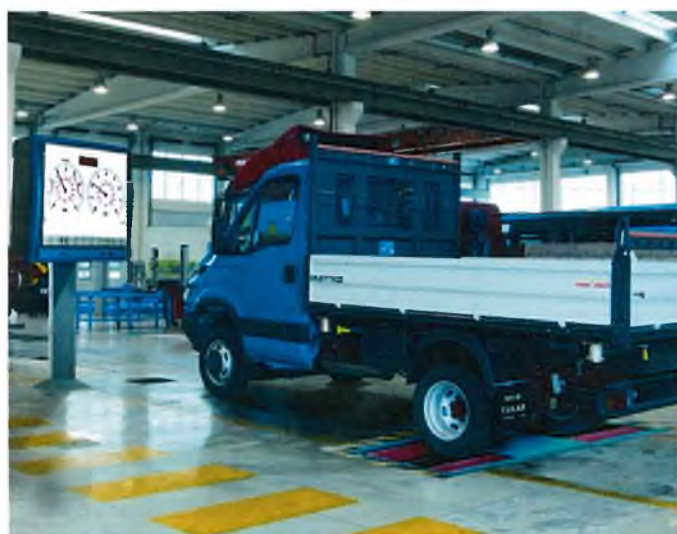
Рисунок 3 – Общий вид стандов тормозных роликовых силовых серии MBT 3000