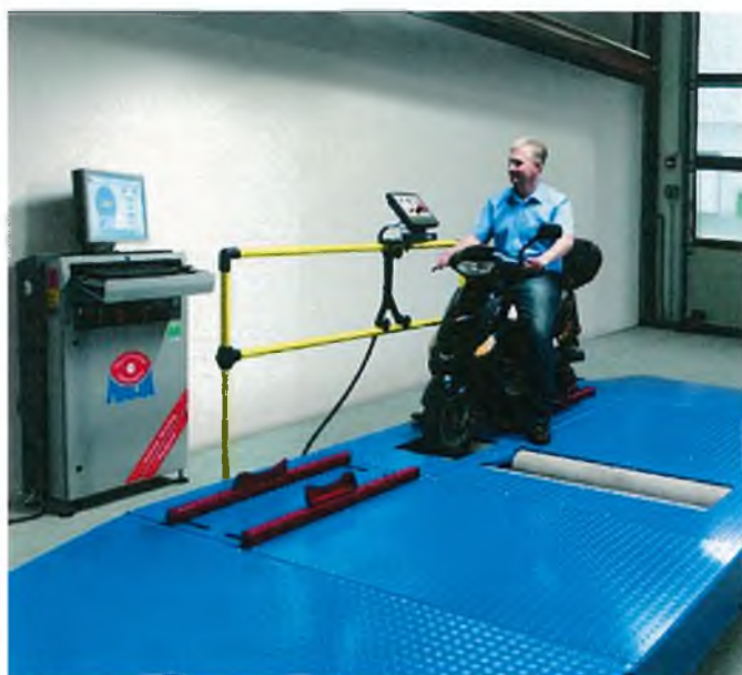
Рисунок 1 – Общий вид стандов тормозных роликовых силовых серии MBT 1000