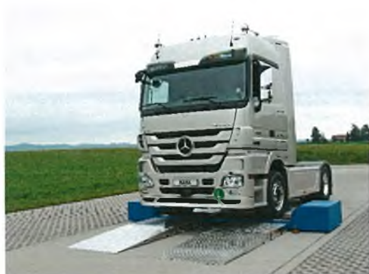
Рисунок 5 – Общий вид стандов тормозных роликовых силовых серии MBT 5000