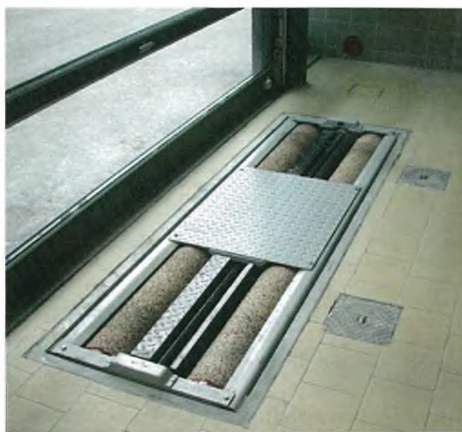
Рисунок 2 – Общий вид стандов тормозных роликовых силовых серии MBT 2000